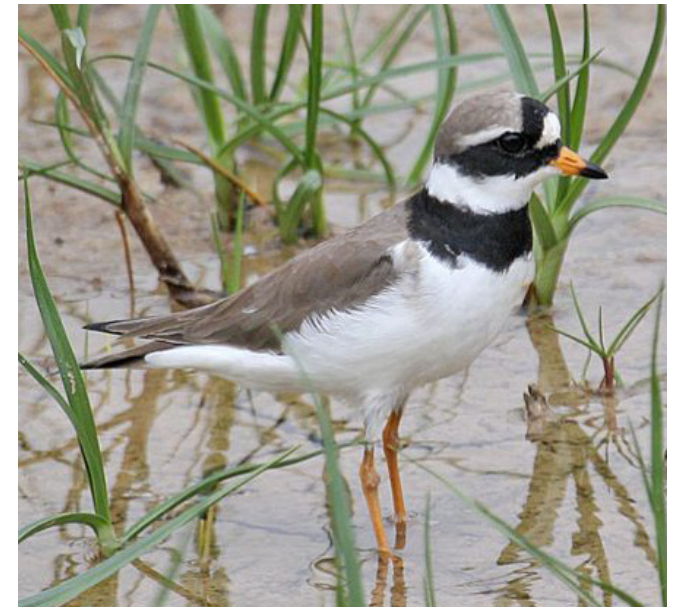
CORRIOL GROS ( Charadrius hiaticula )

Resident i nidificant en zones litorals, majoritàriament s'assenta en els trams rocosos més inaccessibles. Ha experimentat una important regressió en els últims anys, a causa de l'impacte de la sobrepesca sobre algunes de les seves espècies presa, a la contaminació per hidrocarburs i a les molèsties per embarcacions d'esbarjo. A Catalunya està catalogada com a espècie vulnerable (Real Decreto 139/2011), protegida (Categoria C, Decret Legislatiu 2/2008) i molt sensible (Annex II, Decret 148/1992). També està catalogada com a espècie d'interès comunitari objecte de mesures especials quant a la conservació dels seus hàbitats (Annex I, Directiva 79/409/CEE; Annex IV, Llei 42/2007).