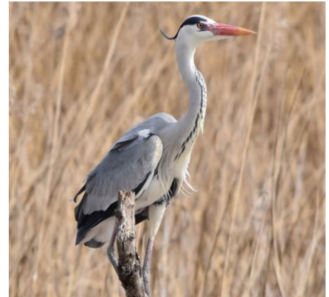
BERNAT PESCAIRE ( Ardea cinerea )

Espècie limícola migrant regular i més estesa per totes les zones humides del territori. Estival nidificant regular, molt abundant al delta de l'Ebre, i freqüent a la resta de zones humides tant de l'interior com del litoral. El seu estat de conservació a Catalunya no és preocupant però està catalogada com a espècie protegida (Categoria C; Decret Legislatiu 2/2008) i sensible (Annex I, Decret 148/1992). També com a espècie d'interès comunitari objecte de mesures especials quant a la conservació dels seus hàbitats (Annex I, Directiva 79/409/CEE; Annex IV, Llei 42/2007).