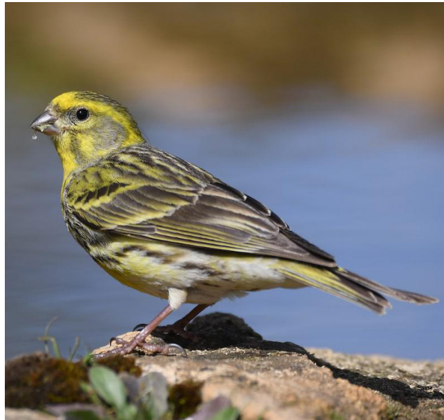
GAFARRÓ ( Serinus serinus )

Espècie migradora regular i comú arreu del territori. Es tracta d'una de les espècies amb major variabilitat en el plomatge. Nidificant estival distribuïda de forma irregular per alguns cursos fluvials, però més uniformement a les zones humides, i també per zones amb prats humits de muntanya. Hivernant molt escassa, però darrerament regular, en zones humides del litoral com el delta del Llobregat o el delta de l'Ebre. Es considera vulnerable a Catalunya i segura a Europa. Està protegida (Categoria D) pel Decret Legislatiu 2/2008.