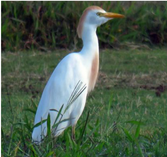
ESPLUGABOUS ( Bubulcus ibis )