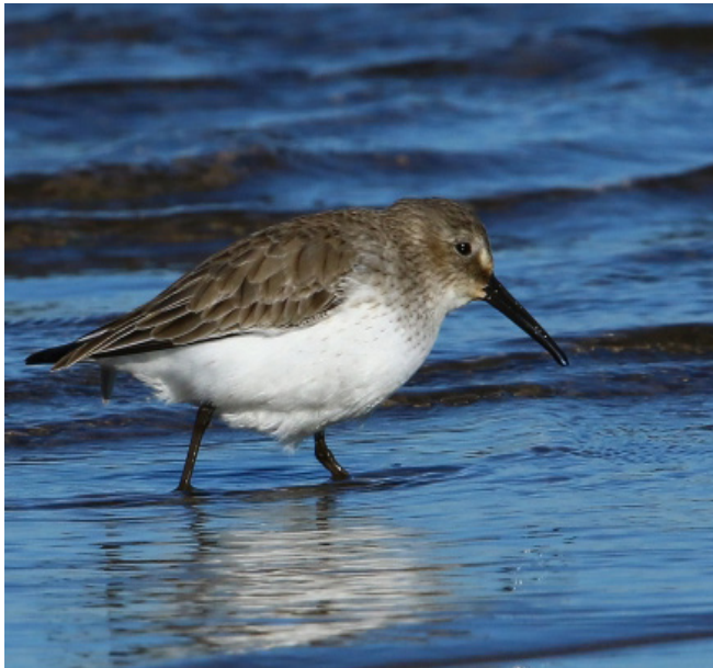
TERRIT VARIANT ( Calidris alpina )