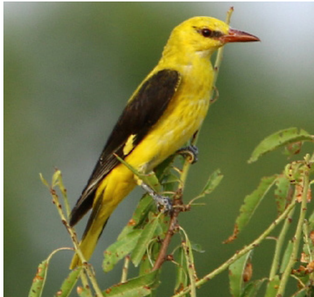
ORIOLE ( Oriolus oriolus )

Espècie migradora, que es pot veure al litoral de forma escassa durant els seus passos migratoris. Nidificant estival localitzada al delta de l'Ebre i altres aiguamolls tant costaners com d'interior. Catalogada com en perill a Catalunya i en declivi a Europa. Es considera una espècie sensible (Annex I, Decret 148/1992), es troba protegida (Categoria B, Decret Legislatiu 2/2008) i és objecte de mesures de conservació especials quant al seu hàbitat (Annex I, Directiva 79/409/CEE; Annex IV, Llei 42/2007).