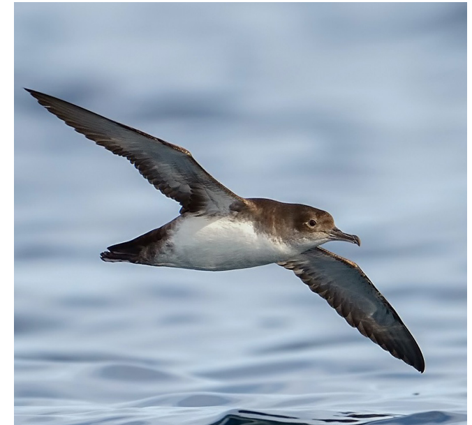
BALDRIGA MEDITERRÀNIA ( Puffinus yelkouan )

Espècie resident, molt comú i amplament distribuïda tant al litoral com a l'interior, en ambients rurals i urbans. Originària d'Àsia i Orient Pròxim es troba en expansió per tota Europa. Ambdós sexes són similars. El seu estat de conservació no és preocupant.