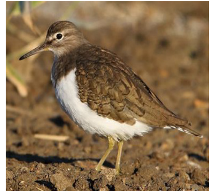
XIVITONA ( Actitis hypoleucos )

Espècie present però no molt abundant durant les migracions i a l'hivern en tota la costa mediterrània. Es reproduïx en molt baix nombre en aiguamolls mediterranis i de la Manxa. A nidificat recentment al delta de l'Ebre. És considerada una espècie en perill a nivell de Catalunya. És per això que està catalogada com a espècie protegida (Categoria C, Decret Legislatiu 2/2008), i com a espècie d'interès comunitari objecte de mesures de conservació especials quant a la conservació dels seus hàbitats (Annex I, Directiva 79/409/CEE; Annex IV, Llei 42/2007).