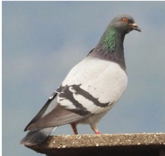
COLOM ROQUER ( Columba livia )

Espècie regular durant l'estiu. Més nombrosa durant els passos migratoris. Accidental com a hivernant. És una de les majors aus marines. D'hàbits pelàgics, està àmpliament distribuïda per l'Atlàntic i el Mediterrani. Està catalogada com a com a protegida (Categoria B, Decret Legislatiu 2/2008) i vulnerable a nivell europeu. També es considera espècie d'interès comunitari objecte de mesures especials quant a la conservació dels seus hàbitats (Annex I, Directiva 79/409/CEE; Annex IV, Llei 42/2007).