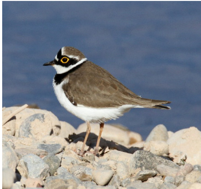
CORRIOL PETIT ( Charadrius dubius )

Espècie endèmica de la conca de la Mediterrània. La Península Ibèrica conté la població més important a nivell mundial en l'actualitat. Es tracta d'una espècie catalogada com protegida (Categoria B, Decret Legislatiu 2/2008) i molt sensible (Annex II, Decret 148/1992). A nivell de Catalunya es considera com una espècie vulnerable i compta amb nombroses figures de protecció i plans de recuperació.