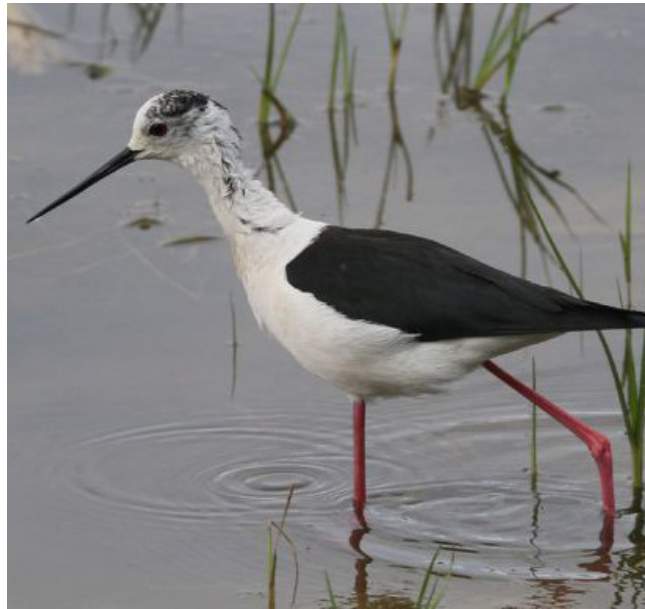
CAMES LLARGUES ( Himantopus himantopus )

Resident i nidificant localment abundant. Migrador i hivernant en àrees on no nidifica. Es tracta d'una espècie cosmopolita i es troba en expansió en l'actualitat, amb observacions cada vegada més habituals en punts on fa anys era més rar. Està catalogada com a espècie protegida (Categoria D, Decret Legislatiu 2/2008) i sensible (Annex I, Decret 148/1992), encara que el seu estat de conservació a Catalunya no és preocupant.