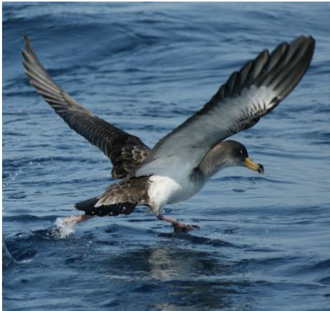
BALDRIGA CENDROSA ( Calonectris diomedea )