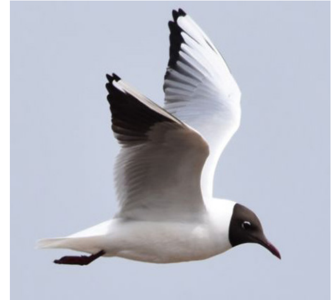
GAVINA VULGAR ( Chroicocephalus ridibundus )

Espècie resident molt abundant, que es completa amb individus migrants i hivernants que varien segons la cruesa dels hiverns. Es tracta de l'espècie d'ànec més comuna a tot el territori i més generalista, capaç d'instal·lar-se en una gran varietat d'aiguamolls, embassaments i estanys en parcs o jardins. El seu estat de conservació tant a nivell català com europeu no és preocupant.