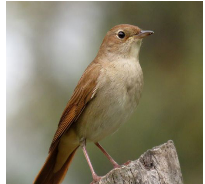
ROSSINYOL ( Luscinia megarhynchos )

Espècie nidificant estival i migradora, comú arreu del territori encara que no distribuïda uniformement com a nidificant, que es pot observar tant en àrees muntanyenques com litorals. Associada sobretot a grans penya-segats rocosos, especialment de l'Espanya calcària, també colonitza en menor grau zones urbanes, on va en augment la seua nidificació. Es troba protegida (Categoria D, Decret Legislatiu 2/2008), però el seu estat de conservació a Catalunya és de preocupació menor.