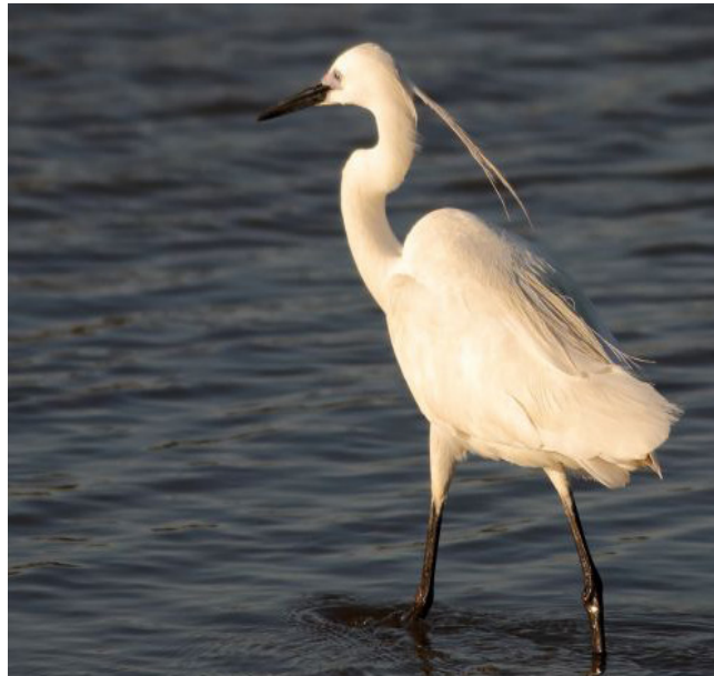
MARTINET BLANC ( Egretta garzetta )

Espècie resident molt comú arreu del territori, que augmenta la seua població a l'hivern. Ambdós sexes són semblants, però la femella té el clatell gris. A l'hivern es torna molt gregària i es reuneix a dormidors. Ocupa una gran diversitat d'hàbitats, tant naturals com humanitzats. El seu estat de conservació a Catalunya està catalogat com de preocupació menor. És tracta de una espècie protegida (Categoria D) segons el Decret Legislatiu 2/2008.