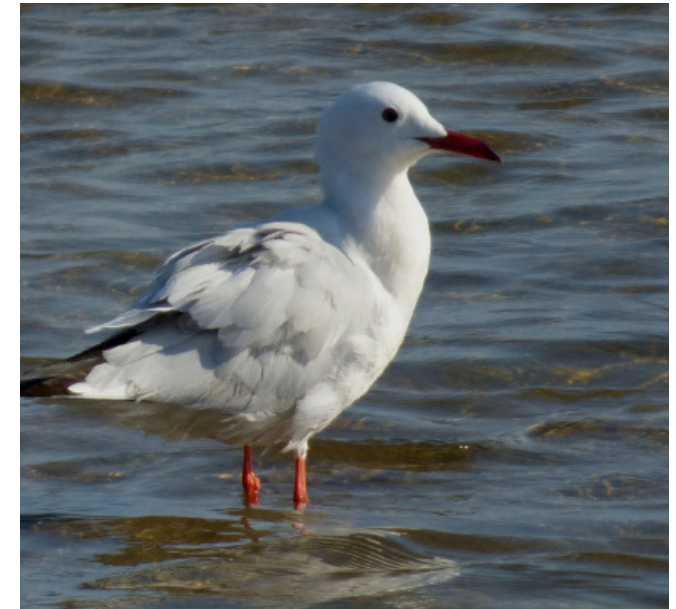
GAVINA CAPBLANCA ( Larus genei )

Espècie sedentària i reproductora per tot el territori, excepte als grans sistemes muntanyencs. Molt adaptable pel que fa a l'elecció de l'hàbitat i a la seua alimentació. La seua inconfusible silueta és una de les imatges més característiques dels paisatges rurals. Es considera de preocupació menor a Catalunya i en declivi a Europa. Està protegida (Categoria C) pel Decret Legislatiu 2/2008.