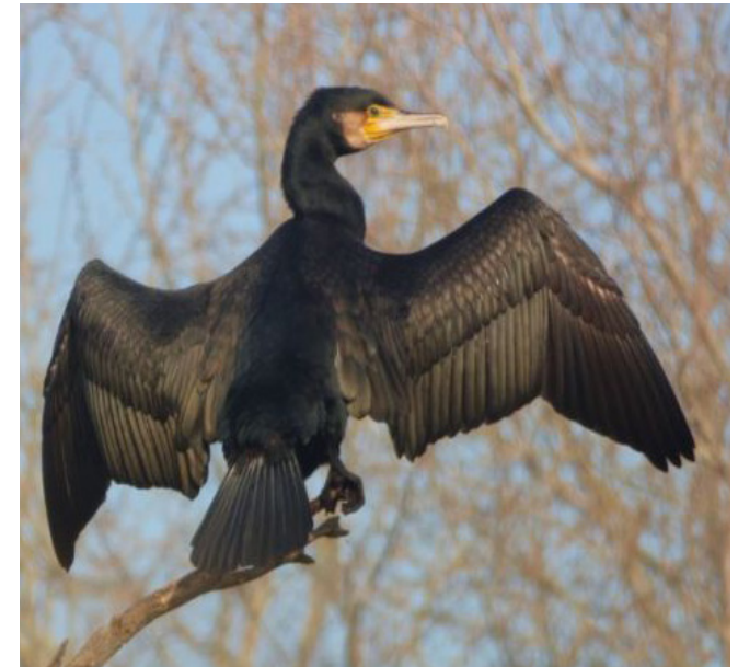
CORB MARÍ GROS ( Phalacrocorax carbo )

Espècie nidificant estival abundant arreu del territori que és torna molt escassa a l'hivern, amb algunes poblacions en zones humides litorals. La seua arribada es considera anunci de la primavera. Malgrat la seua abundància, es tracta d'una espècie en declivi com a conseqüència dels canvis en el medi rural i les zones agrícoles. El seu estat de conservació a Catalunya està catalogat com de preocupació menor. És tracta de una espècie protegida (Categoria D) segons el Decret Legislatiu 2/2008.