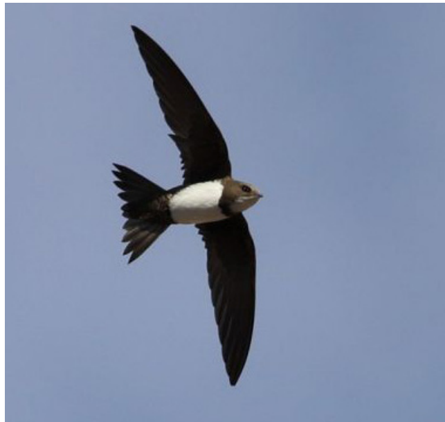
BALLESTER ( Apus melba )

Espècie de garsa d'hàbits nocturns. La seua distribució apareix associada als trams mitjans i baixos dels grans rius amb riberes ben conservades, així com als aiguamolls amb abundant vegetació palustre de la façana mediterrània. Es tracta d'una espècie majoritàriament nidificant estival a la Península, especialment comú al delta de l'Ebre. Migradora regular però hivernant irregular i en escàs nombre. Es considera de preocupació menor a Catalunya i reduïda a Europa. Es troba definida com espècie protegida (Categoria C, Decret Legislatiu 2/2008) i sensible (Annex I, Decret 148/1992). És objecte de mesures de conservació especials quant al seu hàbitat (Annex I, Directiva 79/409/CEE; Annex IV, Llei 42/2007).