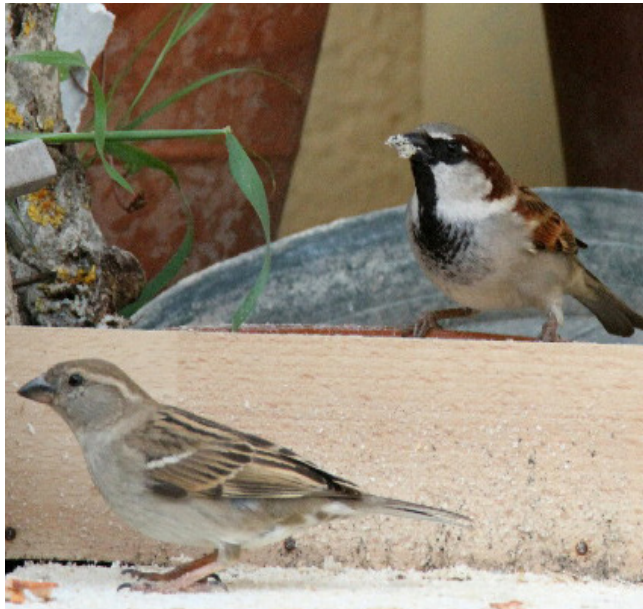
PARDAL COMÚ ( Passer domesticus )

Espècie resident amplament distribuïda gràcies a la seva capacitat per adaptar-se a tots tipus d'ambients, fins i tots els més humanitzats. El seu plomatge blanc i negre és inconfusible. El seu estat de conservació a Catalunya no és preocupant.