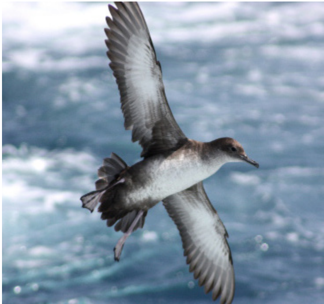
BALDRIGA BALEAR ( Puffinus mauretanicus )