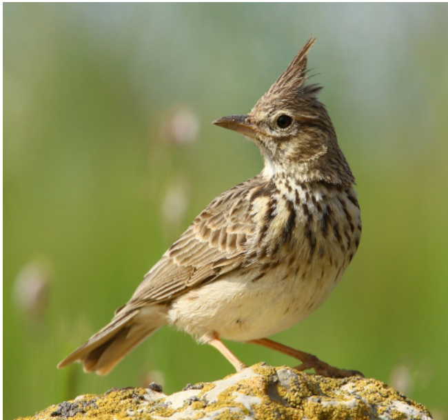
COGULLADA VULGAR ( Galerida cristata )