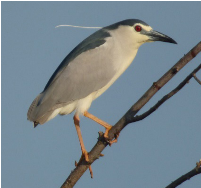
MARTINET DE NIT ( Nycticorax nycticorax )