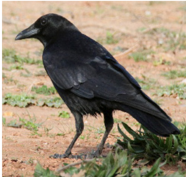
CORNELLA ( Corvus corone )

Espècie nidificant estival i migradora abundant per tot el territori. Molt gregària, construeix colònies de nius adossats a edificis. Està catalogada com en declivi a Europa, però a Catalunya es considera de preocupació menor. Està protegida (Categoria D) segons el Decret Legislatiu 2/2008.