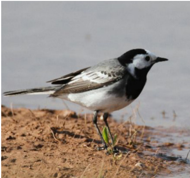
CUERETA BLANCA VULGAR ( Motacilla alba )