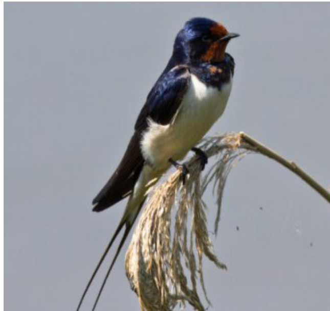
ORENETA VULGAR ( Hirundo rustica )

Espècie present tot l'any al litoral. Durant la seua migració es pot observar en zones costaneres, mentre que a l'hivern es localitza principalment en les platges arenoses pròximes a aiguamolls. Nidifica al delta de l'Ebre. El seu estat de conservació a Catalunya és vulnerable i a nivell europeu és considera reduïda. És una espècie molt sensible (Annex II, Decret 148/1992), es troba protegida per diverses normatives i es objecte de mesures especials quant a la conservació dels seus hàbitats.