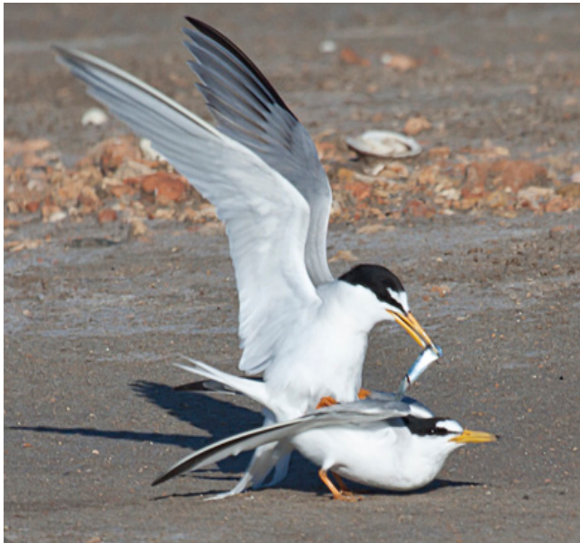
XATRAC MENUT ( Sterna albifrons )