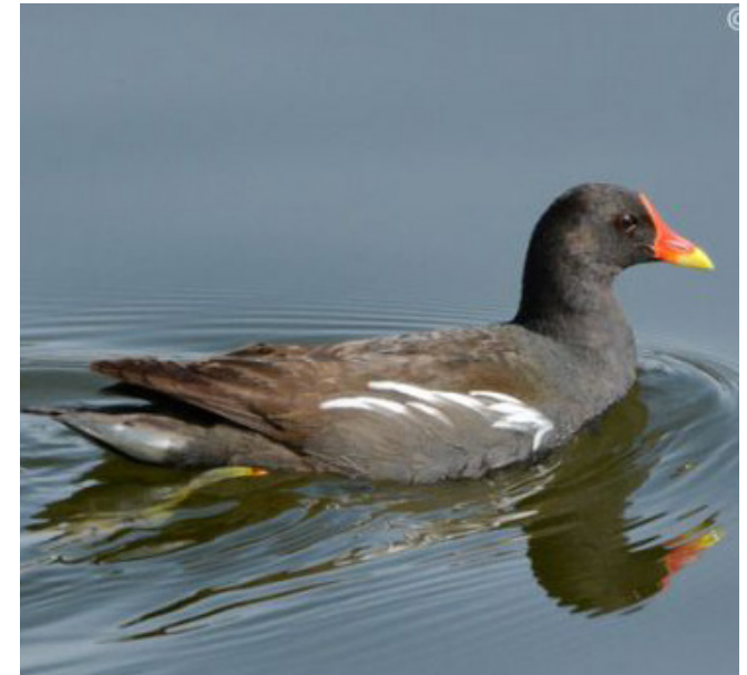
POLLA D'AIGUA ( Gallinula chloropus )

Aquesta espècie es una de les més esteses arreu del territori. Es troba especialment lligada a nuclis urbans ja que és poc exigent pel que fa a l'hàbitat i a l'alimentació. Mascles i femelles tenen un plomatge ben diferenciat. El seu estat de conservació a Catalunya es considera prop a l'amenaça i a Europa en declivi.