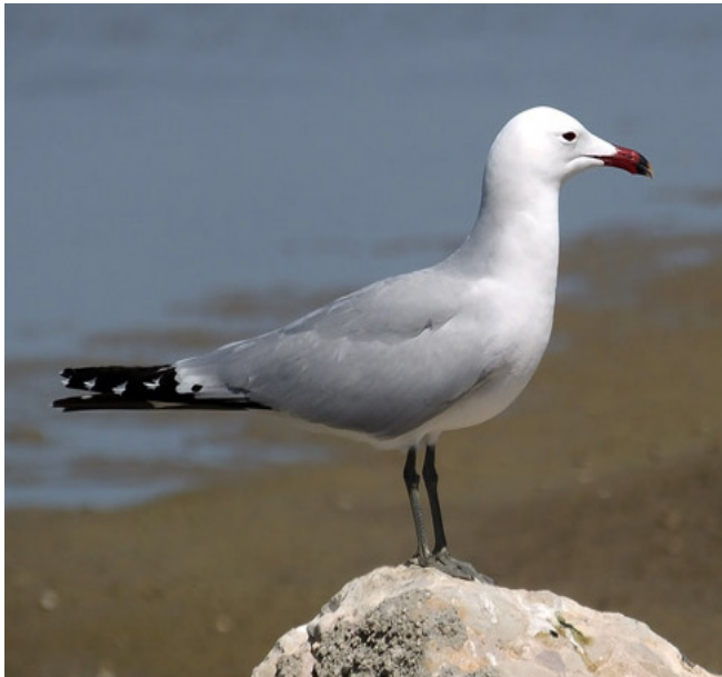
GAVINA CORSA ( Larus audouinii )