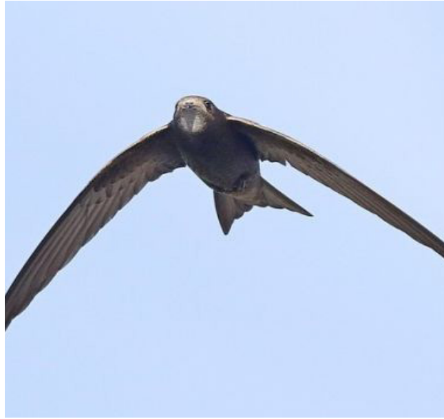
FALCIOT NEGRE ( Apus apus )

Espècie limícola migradora arreu del territori, on ocupa maresmes, saladars i zones humides interiors. Hivernant molt localitzada, especialment al delta de l'Ebre, on hi ha parelles que es reproduïxen. Es considera espècie sensible (Annex I, Decret 148/1992) i es troba protegida (Categoria C) pel Decret Legislatiu 2/2008. El seu estat de conservació està definit com en perill a Catalunya i en declivi a Europa.