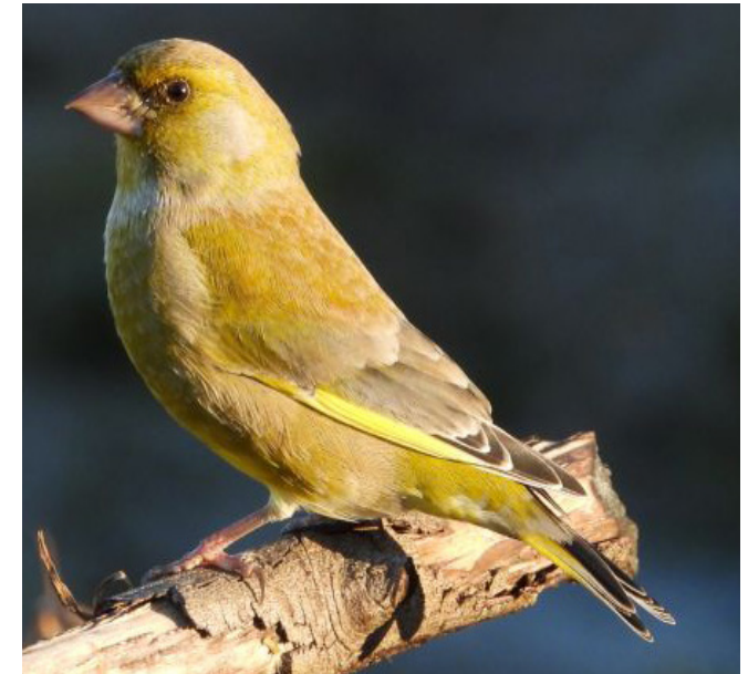
VERDUM ( Chloris chloris )

Espècie resident a gran part de la Península, que es completa a l'hivern amb bastants individus procedents del nord d'Europa. És típica de les àrees rurals de mosaic i les deveses, i per tant, ha estat afectada per la intensificació agrària. Es troba present gairebé a tota Catalunya, on el seu estat de conservació es considera de preocupació menor, però en declivi a Europa.