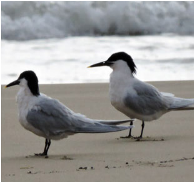
XATRAC BECLLARG ( Sterna sandvicensis )