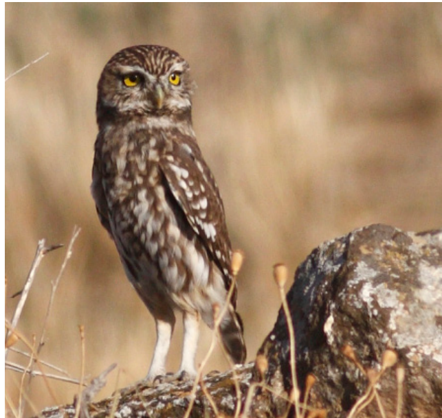
MUSSOL COMÚ ( Athene noctua )

Espècie resident en zones del litoral i d'interior, especialment abundant en zones obertes com conreus, camins rurals i àrees suburbanes. El seu estat de conservació a Catalunya està catalogat com de preocupació menor. És tracta de una espècie protegida (Categoria D) segons el Decret Legislatiu 2/2008.