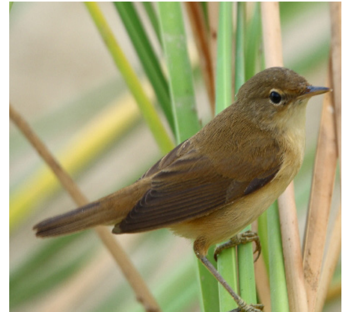
BOSCARLA DE CANYAR ( Acrocephalus scirpaceus )

Espècie nidificant estival molt comuna a tot arreu del territori i migradora regular, especialment per les zones de terra baixa ja que defuig les zones més muntanyenques. És una de les espècies ibèriques més acolorides encara que d'hàbits reservats. El seu cant aflautat és molt característic dels paisatges riberencs, tot i que es pot trobar en altres tipus de bosc i en plantacions de fruiters. El seu estat de conservació és de preocupació menor a Catalunya i segur a Europa. Està catalogada com espècie protegida (Categoria D) pel Decret Legislatiu 2/2008.