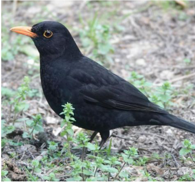
MERLA ( Turdus merula )