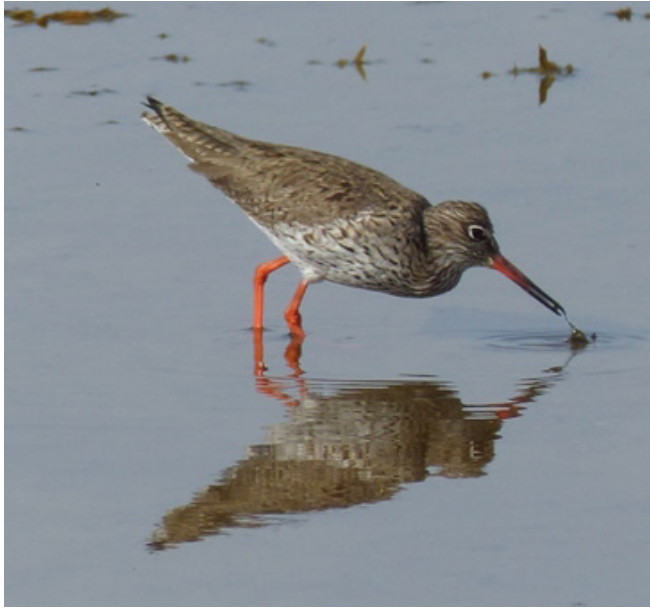
GAMBA ROJA VULGAR ( Tringa totanus )