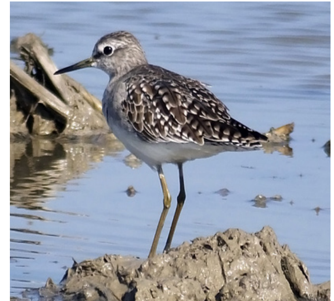
VALONA ( Tringa glareola )

Espècie comú arreu del territori, però especialment al litoral i a les zones de terra baixa de caire mediterrani, on hiverna i es pot veure en migració. Presenta un comportament gregari a l'hivern amb altres fringíl·lids granívors. Habita tant àrees forestals obertes com parcs amb arbrat. A Catalunya es troba propera a l'amenaça i està protegida (Categoria D) pel Decret Legislatiu 2/2008.