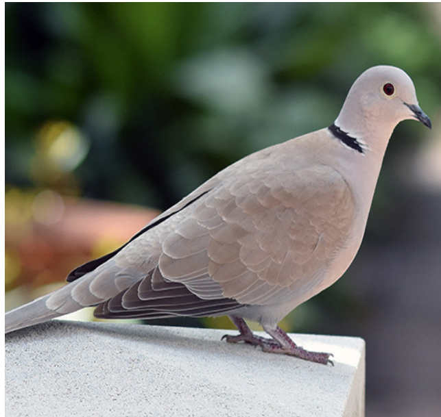
TÓRTORA TURCA ( Streptopelia decaocto )

Espècie marina de gran envergadura. Encara que no cria a Espanya, resulta una espècie habitual a tot el litoral durant els passos migratoris i a l'hivern. Es considera segura a Europa i està protegida (Categoria C) pel Decret Legislatiu 2/2008.