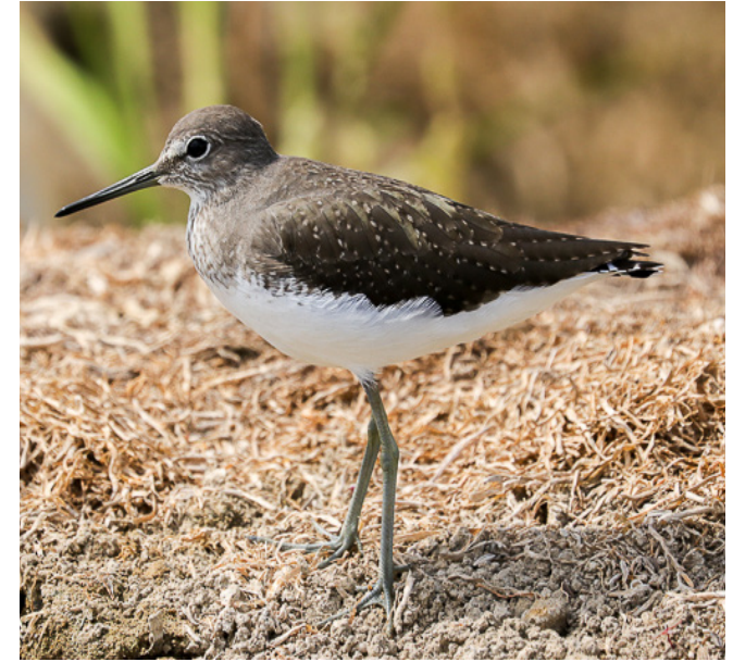
XIVITA ( Tringa ochropus )

Espècie nidificant estival i migradora, molt lligada als nuclis urbans on fa els seus nius. Poden desenvolupar tot el seu cicle vital en l'aire, excepte la nidificació. A Catalunya es considera de preocupació menor i està protegida (Categoria D) pel Decret Legislatiu 2/2008.