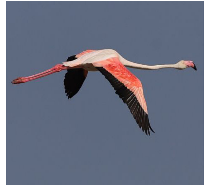
FLAMENC ( Phoenicopterus roseus )

Espècie àmpliament distribuïda per tota la Península Ibèrica. La forma silvestre ocupa principalment penya-segats costaners, falçs fluvials i barrancs rocosos a serres, mentre que la forma domèstica s'associa a assentaments humans. Encara que aparentment és abundant, el seu alt grau d'hibridació amb la forma domèstica pot comprometre seriosament la seva identitat genètica com a espècie silvestre. A Catalunya el seu estat de conservació no és preocupant.