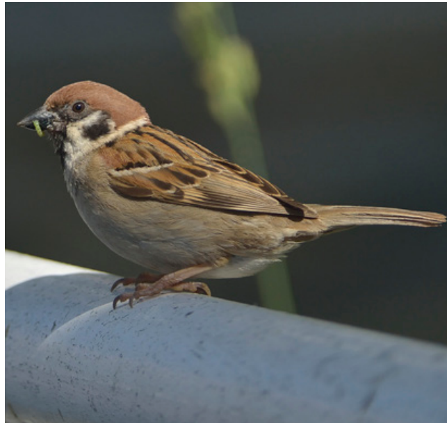
PARDAL XARREC ( Passer montanus )

Espècie amb presència regular gairebé tot l'any, però molt més escassa a l'estiu. Està considerada com l'única au marina endèmica d'Espanya. Com el seu nom indica, cria a les illes Balears. Fora de l'època de cria es pot veure al llarg de les costes ibèriques en els seus desplaçaments cap a les zones d'hivernada. A l'hivern arriba a formar concentracions d'alguns milers d'individus en punts de la costa. A nivell europeu està catalogada com en perill crític. A nivell nacional també està protegida (Categoria A, Decret Legislatiu 2/2008) i catalogada com en perill d'extinció (Real Decret 139/2011).