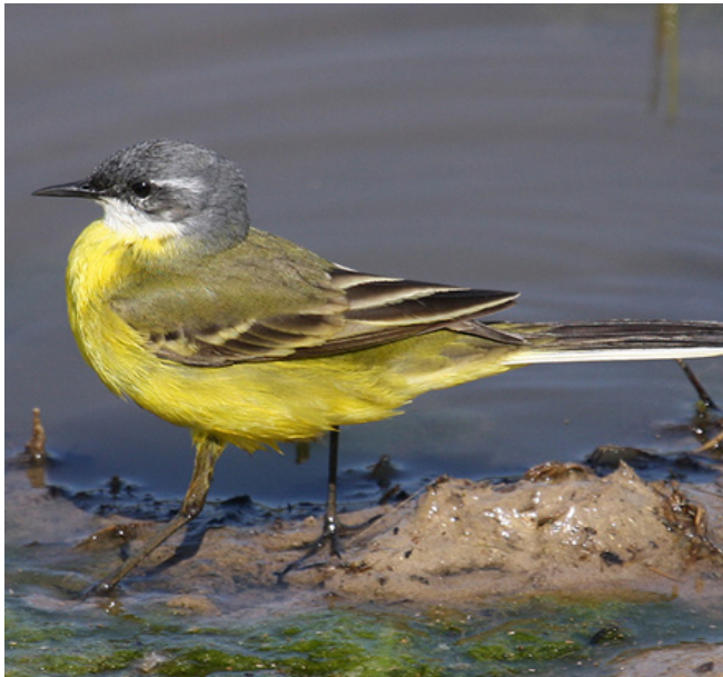
CUERETA GROGA ( Motacilla flava )