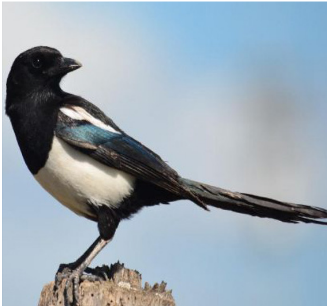
GARSA ( Pica pica )