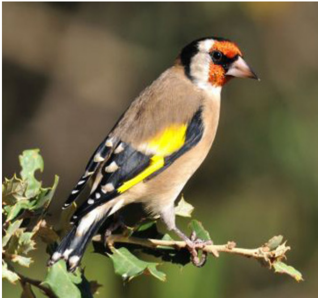
CADERNERA ( Carduelis carduelis )