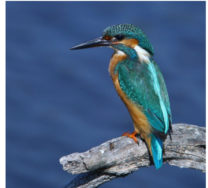
BLAUET ( Alcedo atthis )

Espècie resident comú arreu del territori, especialment en terres baixes i amb certa humitat, com riberes i canyissars de rius i aiguamolls. Migradora i hivernant comú, especialment en zones litorals, com per ex. el delta de l'Ebre. Està catalogada com a espècie protegida (Categoria D, Decret Legislatiu 2/2008), però el seu estat de conservació a Catalunya no és preocupant.