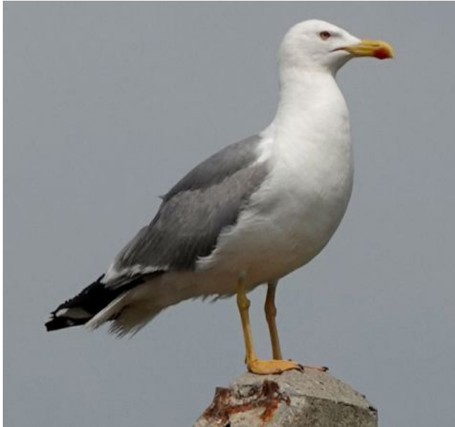
GAVIÀ ARGENTAT ( Larus michahellis )