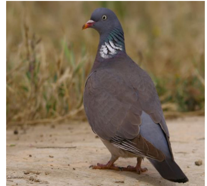
TUDÓ ( Columba palumbus )

Espècie resident i nidificant localment abundant als aiguamolls i zones humides de Catalunya, així com a les zones d'arrossars on troba aliment. El seu estat de conservació a Catalunya està catalogat com de preocupació menor, encara que es troba protegida per nombroses directives relacionades amb la mateixa espècie o el seu hàbitat.