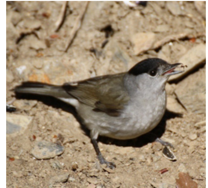
TALLAROL DE CASQUET ( Sylvia atricapilla )

Espècie resident de distribució regular tant a l'interior com a la costa. Defuig l'àrea d'influència litoral, però s'hi pot presentar de manera local. Ocupa tota mena d'hàbitats i té un paper molt beneficiós com controladora de plagues agrícoles. El seu estat de conservació a Catalunya es considera de preocupació menor.