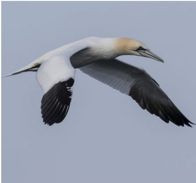
MASCARELL ( Morus bassanus )