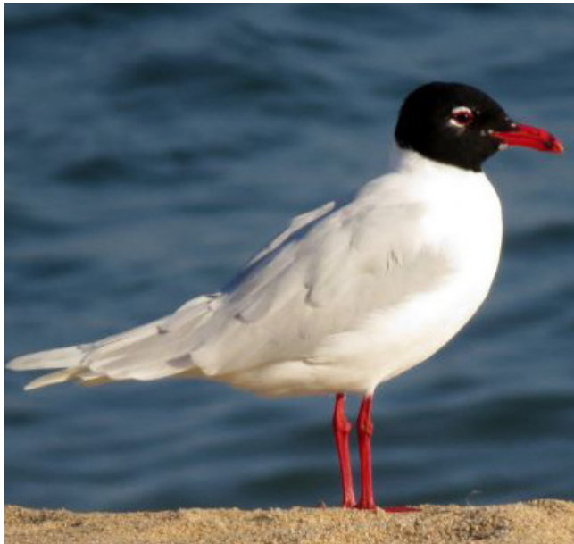
GAVINA CAPNEGRA ( Larus melanocephalus )

Espècie resident comú distribuïda regularment arreu del territori, que es pot observar a diferents altituds i en diferents tipus d'hàbitats encara que és més abundant en les zones més termòfiles i de caire mediterrani. Migradora i hivernant comú arreu del país. És molt gregària, sobretot a l'hivern, i sol agrupar-se en bàndols mixtos amb altres fringíl·lids. A causa del seu aspecte i vistós cant ha siguda capturada amb freqüència com a au de gàbia. El seu estat de conservació a Catalunya es considera vulnerable i està protegida (Categoria D; Decret Legislatiu 2/2008).