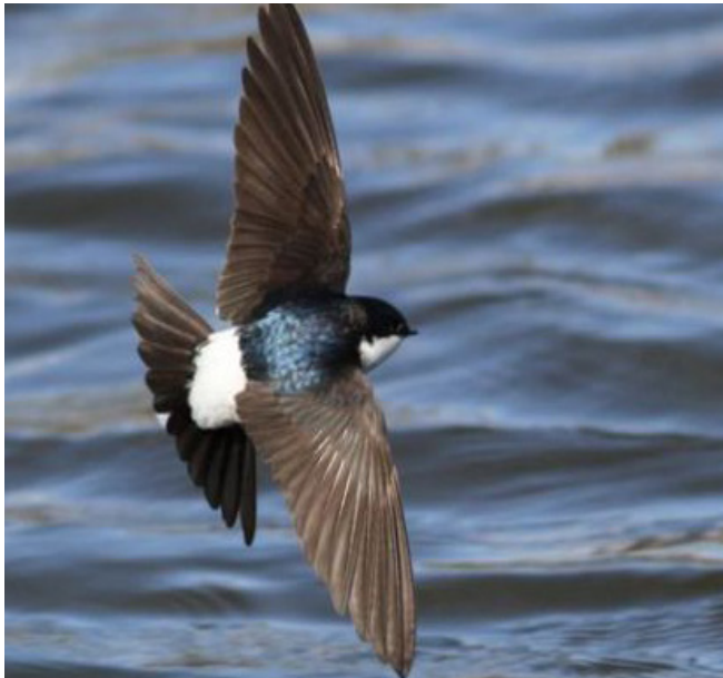
ORENETA CUABLANCA ( Delichon urbicum )