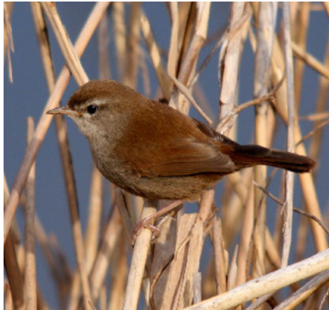
ROSSINYOL BORD ( Cettia cetti )

Espècie migradora regular, especialment pel litoral, on és freqüent la seua observació a les platges i aiguamolls costaners. Hivernant regular i molt comú al delta de l'Ebre, i molt més escassa a la resta de zones humides. Es considera reduïda a Europa. Està catalogada com protegida (Categoria C, Decret Legislatiu 2/2008) i és objecte de mesures de conservació especials quant al seu hàbitat (Annex IV, Llei 42/2007).