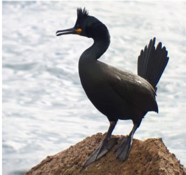
CORB MARÍ EMPLOMALLAT ( Phalacrocorax aristotelis )

Espècie d'ocell molt estesa i habitual. Es considera un resident comú arreu del territori, però també és migrador i hivernant regular. Ocupa tot tipus de zones cobertes per arbustos i matolls, incloent boscos, parcs i jardins. És omnívor, menja una gran varietat d'insectes, cucs de terra, baies i fruites. El mascle és negre i la femella marró. Atesa la seua abundància a Catalunya, el seu estat de conservació es considera de preocupació menor.