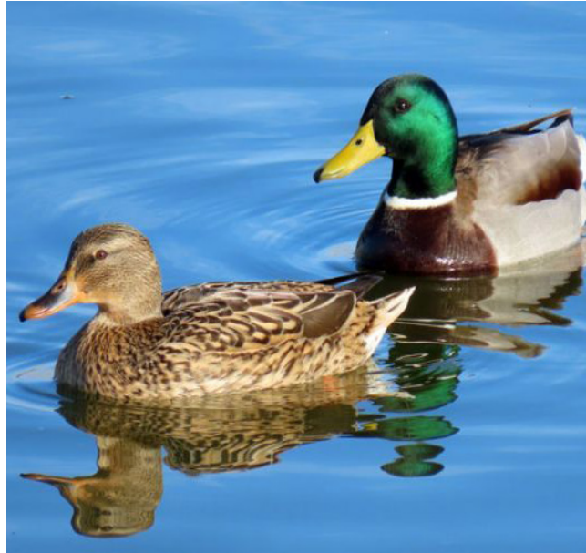
ÀNEC COLLVERD ( Anas platyrhynchos )

Espècie molt comuna al llarg de l'any, tant a les costes i desembocadures dels rius com a l'interior, on es troba en expansió. També és una espècie migradora. Es tracta d'un dels ocells marins més abundants de la conca de la Mediterrània, a causa de la seva enorme adaptabilitat tant per alimentar-se com per a triar hàbitat. Al delta de l'Ebre existeix una de les seves principals colònies de parelles reproductores. El seu estat de conservació a Catalunya és poc preocupant.