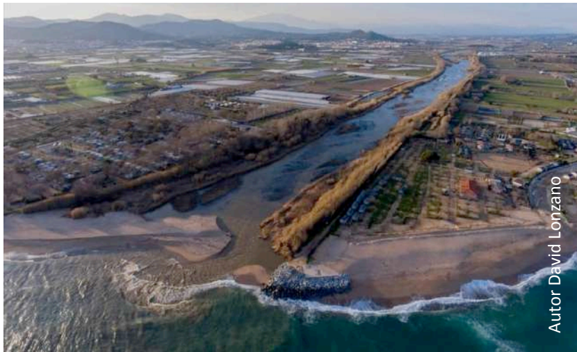
Autor David Lonzano

El projecte REDAPTA “Espais de governança per a l’adaptació al canvi global en rius mediterranis”, es desenvolupa de manera paral·lela al Riu Tordera (Catalunya) i al Riu Serpis (Comunitat Valenciana).