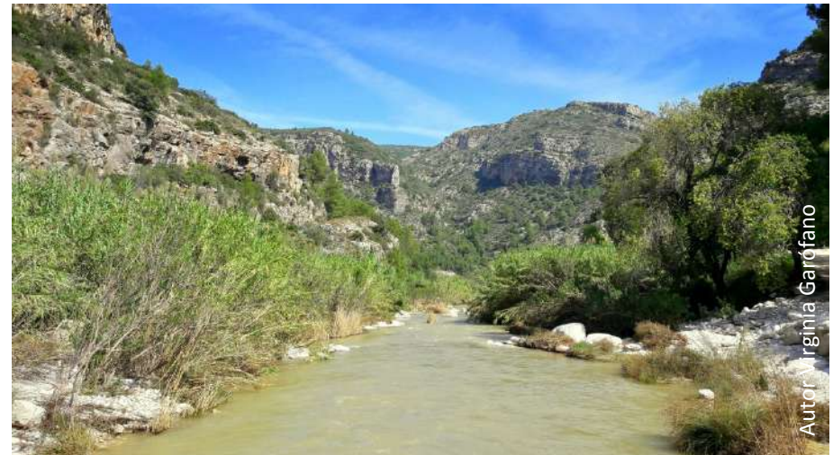
Autor Virginia Garófano