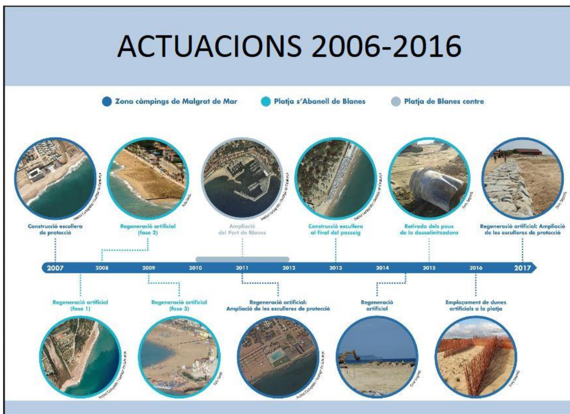
Figura 2: actuacions antròpiques realitzades entre el 2006 i 2016.

Una de les metodologies utilitzades per l'Enric és la anàlisi de les fotografies del territori, en col·laboració amb l'Arxiu Municipal de Blanes. Una visió històrica ajuda a entendre la