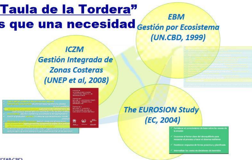
Figura 1: marc lògic dels 3 aspectes claus de la Gestió Integrada de Zones Costaneres